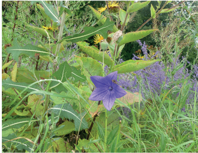
Kräuter der Natur